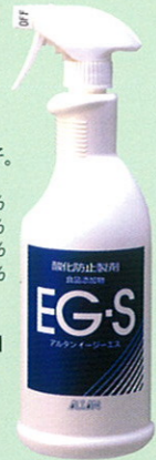
品番 OB-2 10L 品番 OB-1 1L×10