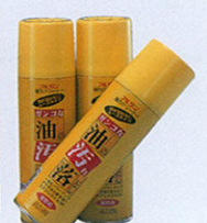
品番 OD-10 480ml×30