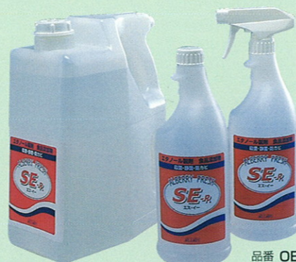
品番 TB-2 15kg 品番 OB-8 4L×4 品番 OB-7 1L 詰替用×12 品番 OB-6 1L スプレー付×12