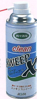
品番 OC-2 450g×24