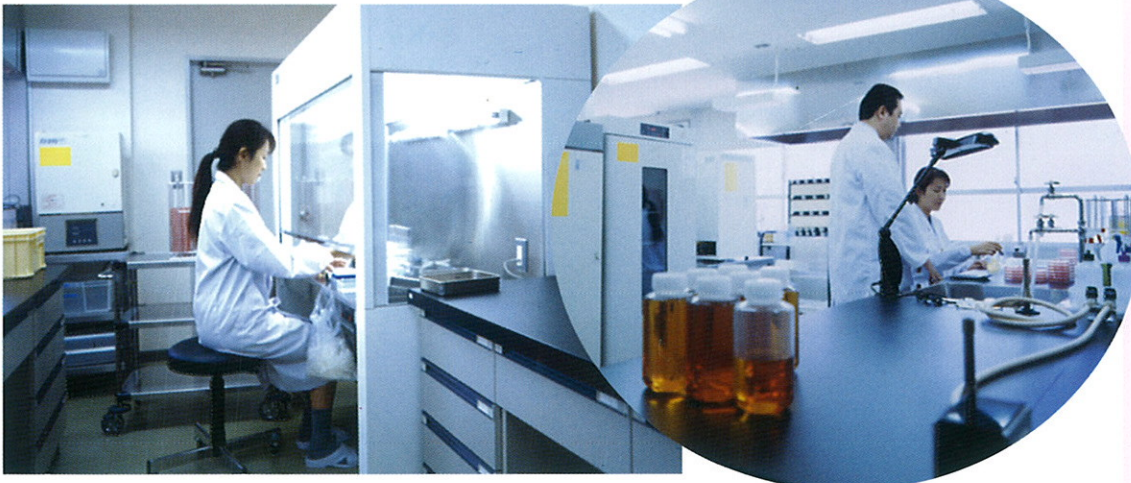
研究室ならびに菌検査室