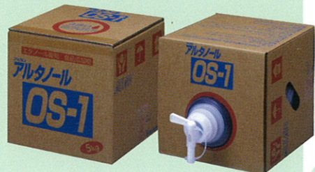
品番 OB-9 5kg×3 品番 OB-10 18kg