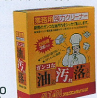
品番 OD-10 480ml×30