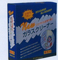
品番 OD-14 100g×120 品番 OD-15 5kg×2