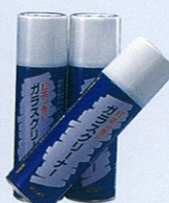
品番 OD-11 480ml×30