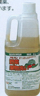
品番 OD-2 2kg×6