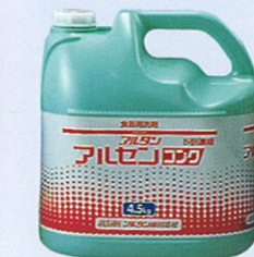
品番 OD-3 4.5kg×4