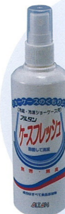
品番 OD-7 150ml×30