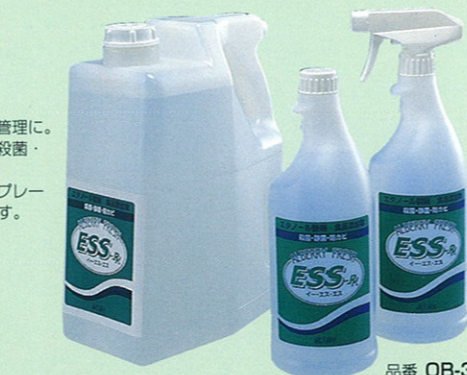
品番 TB-1 15kg 品番 OB-5 4L×4 品番 OB-4 1L 詰替用×12 品番 OB-3 1L スプレー付×12