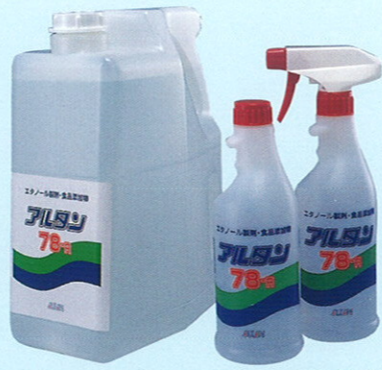
品番 TA-1 15kg 品番 OA-5 4L×4 品番 OA-4 500ml 詰替用×30 品番 OA-3 500ml スプレー付×30