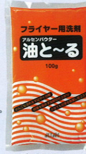
品番 OD-14 100g×120 品番 OD-15 5kg×2