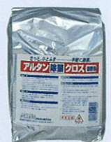
品番 OD-9 詰替用×6