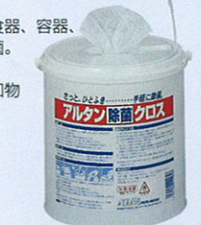
品番 OD-8 容器入り×4