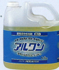
品番 OD-13 4.5kg×4